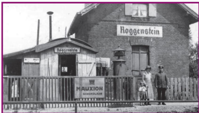
Haltestelle der Königlich Bayerischen Staatsbahn beim Gut Roggenstein. Das voluminöse Läutewerk erinnert an Zeiten ohne Telefon. Die Glockensignale kündigten dem Wärter die Annäherung eines Zuges an.